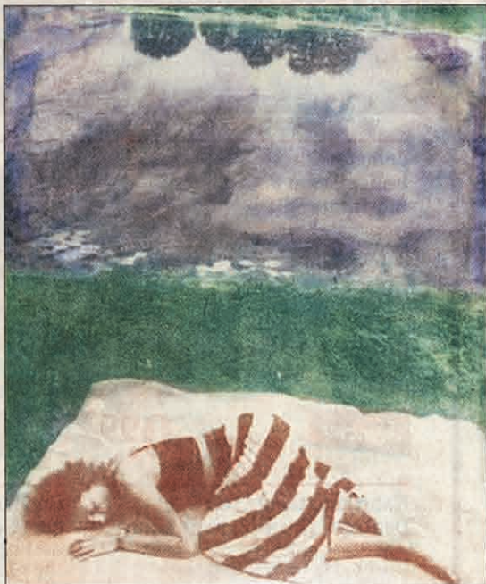
„Am Fluss“: Gummidruck auf Papier von Frank Hellwig.