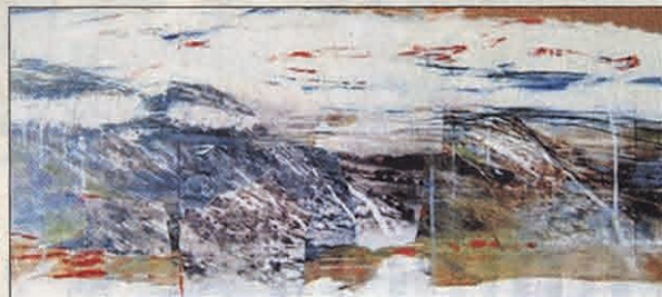
„Jura 1“: Digital C-Print von Peter Winter.